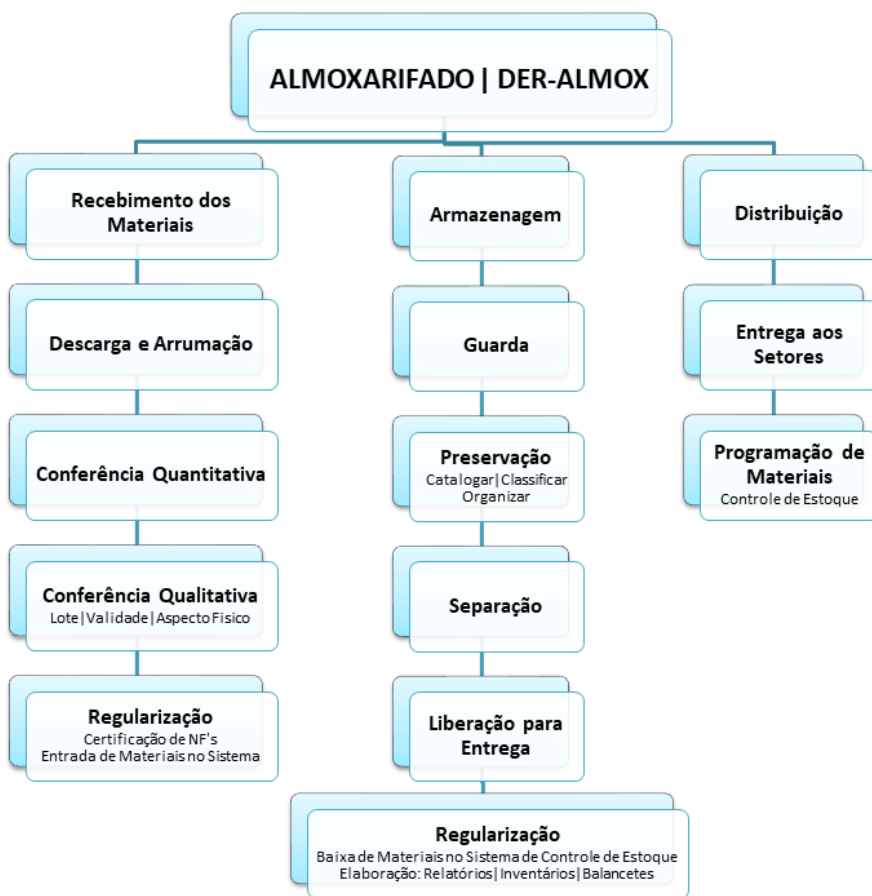
Figura 1: Fluxograma de trabalho do Almojarifado | DER-ALMOX-Autor: Gleysson Francisco Shreder da Silva – Almojarife | DER-RO